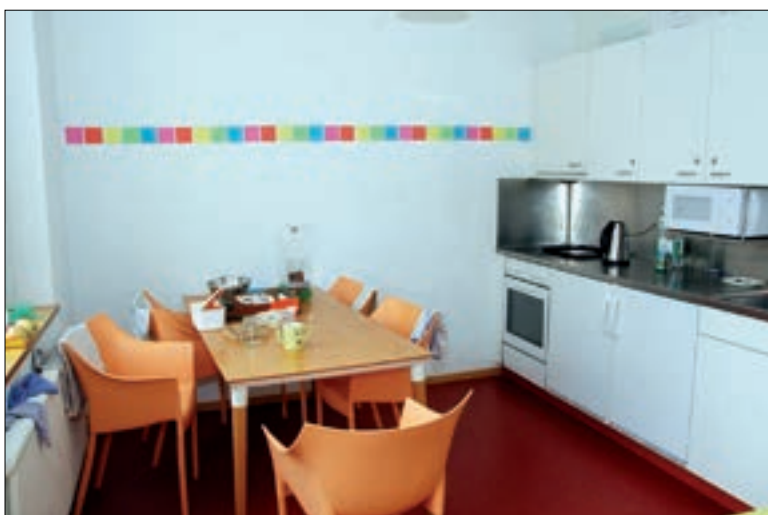
Vue sur une chambre et sur une cuisine commune.